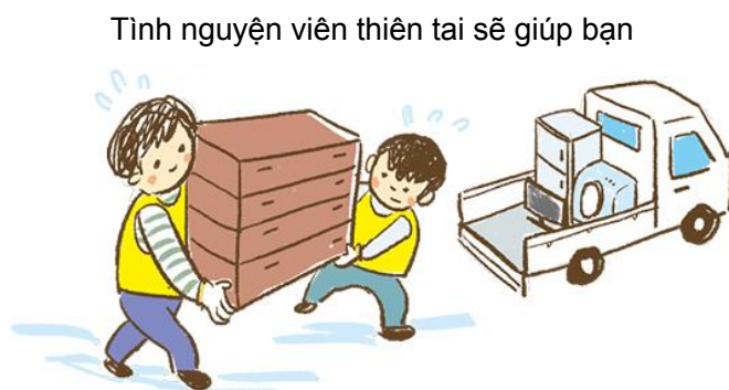
Tình nguyện viên thiên tai sẽ giúp bạn

Hãy liên lạc với đại sứ quán hoặc cục xuất nhập cảnh.