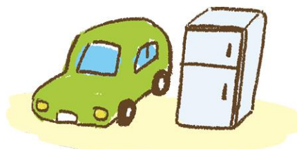
Ô tô, đồ điện gia dụng v.v..

Có rất nhiều người đăng ký với “Trung tâm tình nguyện thiên tai”. Đừng cố gắng quá sức riêng với các thành viên gia đình mà hãy nhờ tình nguyện viên giúp đỡ. Hãy liên lạc với Trung tâm tình nguyện thiên tai, Hiệp hội phúc lợi xã hội hoặc uỷ ban thành phố. Bạn sẽ được tình nguyện viên giúp đỡ không mất phí.