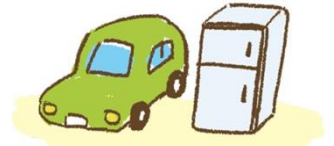
Araba ve elektrikli aletler

Araba, buzdolabı gibi diğer elektrikli aletler de dahil olmak üzere çok fazla çöp olacağından çöpler her zamanki yerinde toplanmaz. Çöplerinizi nereye ve ne zaman atabileceğiniz konusunda belediyeye veya komşunuza danışın.