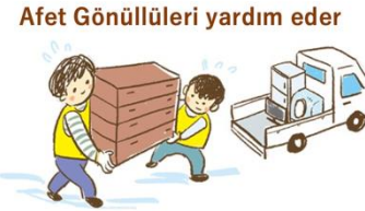
Afet Gönüllüleri yardım eder

Birçok gönüllü 'Afet Gönüllüleri Merkezi'ne kayıtlıdır. Sadece ailenizle temizlik yapmak yerine, gönüllülerden de yardım alın. Afet Gönüllü Merkezi, Sosyal Yardım Kurumu ya da belediye ile görüşün. Size ücretsiz olarak yardımcı olabilirler.