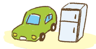
汽车・家电制品等

会有诸如汽车、冰箱等大量的家电制品垃圾，一般的垃圾站不收集这样的垃圾。请向市役所及周围邻居确认扔垃圾的地点和时间。