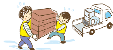
救灾志愿者会帮忙

许多志愿者已在灾难志愿者中心注册。与其独自和家人一起清理，不如请志愿者来帮忙。请向灾害志愿者中心、社会福祉协议会、市役所商量，可以免费接受帮助。