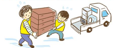
Kayo ay tutulungan ng mga disaster volunteer.

Maraming boluntaryo ang rehistrado sa Disaster Volunteer Center. Hindi lamang sa miyembro ng pamilya kundi magpatulong rin sa mga boluntaryong ito sa paglilinis. Sumangguni sa Disaster Volunteer Center, Social Welfare Association o munisipyo. Walang bayad ang pagtulong ng mga boluntaryo.