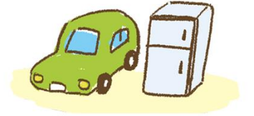
गाडि तथा फ्रिज लगाएतका बिद्दुतिय सामानहरु

गाडि तथा फ्रिज लगाएतका बिद्दुतिय सामानहरु प्रशस्त मात्रामा फोहोरको रुपमा निस्कने भएकाले सधै फोहोर फाल्ने ठाँउमा फोहोर लिन आउदैन । नगरपालिका अथवा छिमेकि सँग फोहोर फाल्ने ठाँउ र समयको जानकारी लिनुहोस ।