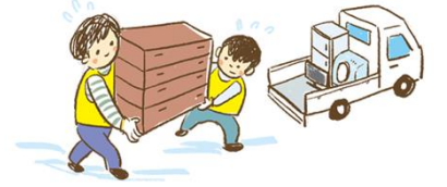
स्वयम् सेवक हरुको सहयोग लिनुहोस

धेरै स्वयम् सेवक हरुले [प्रकोप स्वयम् सेवक केन्द्र ] मा दर्ता गरेका हुन्छन । परिवारले मात्रै घरको सबै सामानहरु मिलाउँदा गाह्रो हुने भएकाले स्वयम् सेवक हरुको मद्दत लिनुहोस । प्रकोप स्वयम् सेवक केन्द्र , समाज कल्याण परिषद् नगरपालिकामा सल्लाह गर्नुहोस । निशुल्क सहयोग पाइन्छ ।