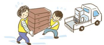
Волонтери, які допомагають під час катастрофи

Багато волонтерів зареєстровані у центрі волонтерів які допомагають під час катастроф. Не залишайте свою сім'ю прибирати на самоті, заручіться допомогою волонтерів. Проконсультуйтеся з волонтерським центром, радою соціального захисту чи мерією. Ми можемо допомогти вам безкоштовно.